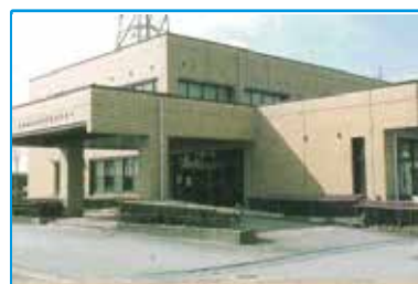
砺波まなび交流館 建物外観

〒933-0806 高岡市赤祖父 679 / TEL：0766-22-8510 / 担当：イワコシ・コヤマ