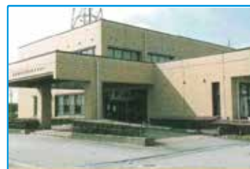
砺波まなび交流館 建物外観

〒933-0806 高岡市赤祖父679 / TEL: 0766-22-8510 / 担当: イワコシ・コヤマ