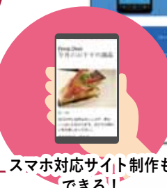
スマホ対応サイト制作も できる！