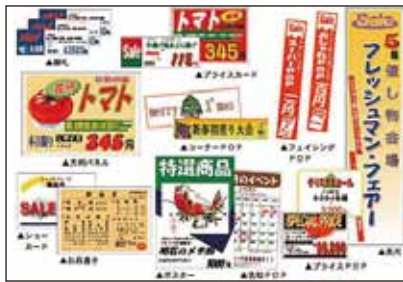
お店のPOP、広告ちらし制作

支給額 職業訓練受講手当 月額 10 万円、および通所手当 (通所経路に応じた所定の額)