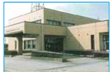
砺波まなび交流館 建物外観

〒933-0806 高岡市赤祖父 679 / TEL: 0766-22-8510 / 担当: イワコシ・コヤマ / URL: http://tbschool21.com