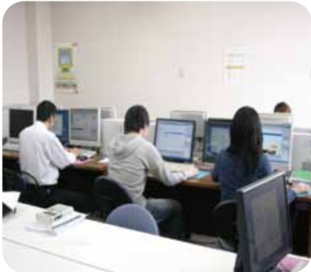
パソコン授業（ワード・エクセル・パワーポイント ・POPちらし作成・ホームページ作成など）

支給額 職業訓練受講手当 月額 10 万円、および通所手当（通所経路に応じた所定の額）