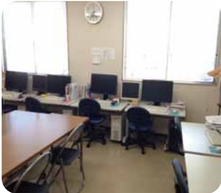
明るく広々とした環境の教室