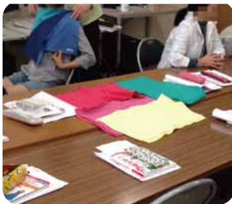
パーソナルカラー授業