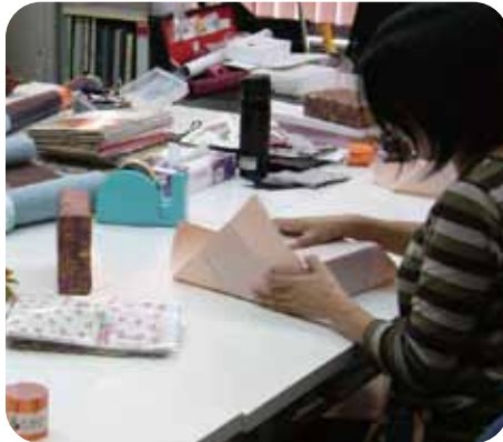
ラッピング実技演習