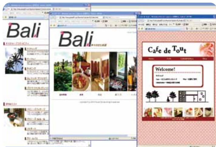
画像編集・加工の授業